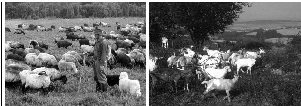
Abbildung 2: Biotoppflege mit Schafen (Lüneburger Heide) und Ziegen (Entbuschung auf Kalkmagerrasen)

schaffen können (Rahmann, 1998). Biotopfutter liefert nicht die notwendigen Mineralstoffe, eine Zufütterung mit Mineralstoffen ist notwendig. Die Folgen eines Mangels an den verschiedenen Vitaminen sind eher unwahrscheinlich. Eine Zufütterung ist nicht notwendig. Eine ausreichende Mineralstoff- und Salzversorgung ist ohne Probleme mit Leckschalen zu gewährleisten. Sie wird im Naturschutz nicht als verbotene Zufütterung bewertet. Es ist auf ökologisch zertifizierte Mineralstoffe zu achten. Schafe brauchen Kupfer armes Mineralfutter, Ziegen können das gleiche wie Kühe erhalten.